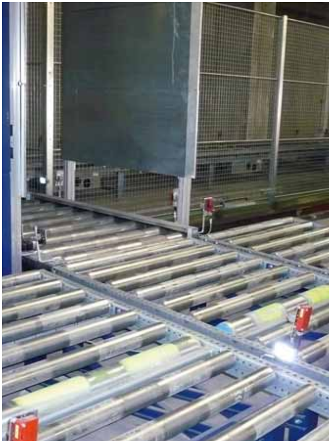
BTR 800 L | 800 kg | 3°